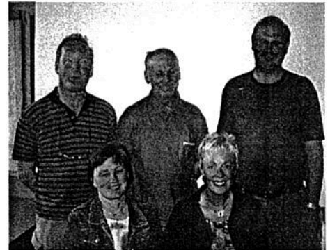
Det første styret i bygdeutvalget. Lykke til med arbeidet !

Vi innhentet informasjon om hvordan andre bygdeutvalg har arbeidet . Både Utskarpen og Selfors har velvillig gitt oss innspill .