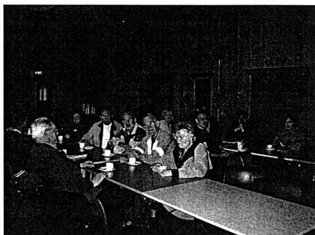
Fra stiftelsesmøtet på samfunnshuset.

En slik endring vil påvirke all offentlig virksomhet og alle etater er pålagt å følge opp en slik navneendring.