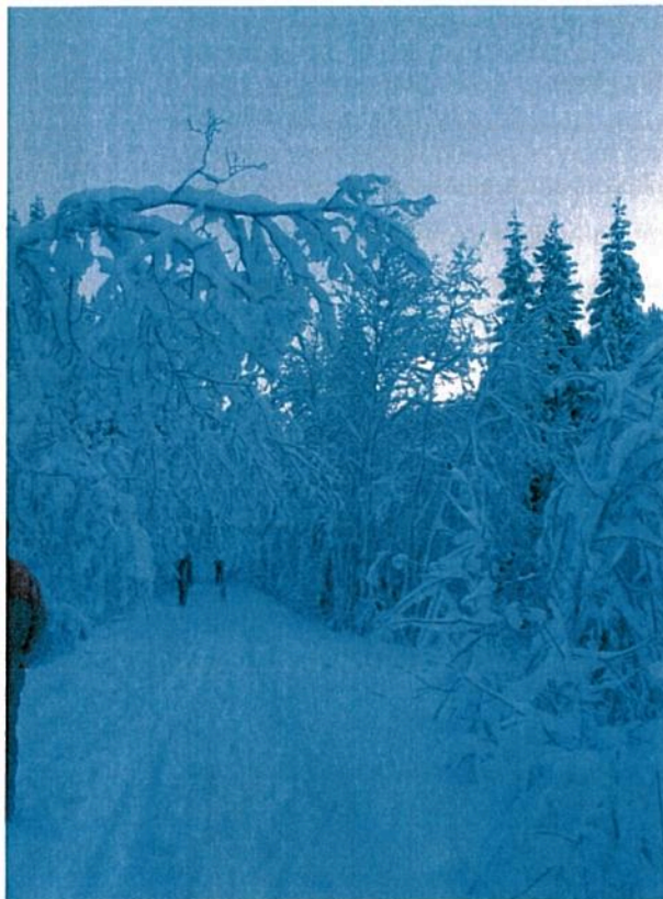
Vinterstemning fra skogsbilveien !