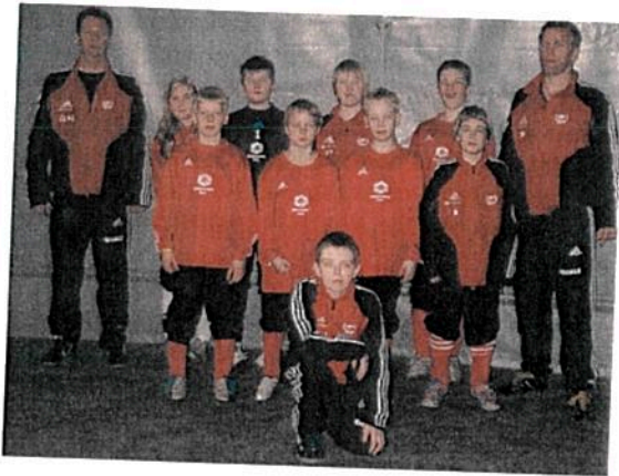
Trenerne med the dream-team.