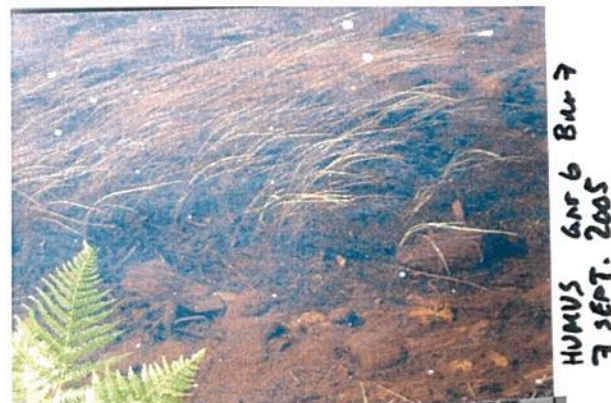
Slam i bunnen av elva.