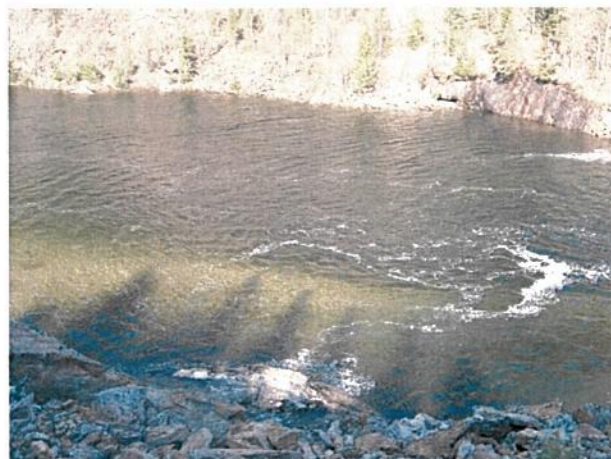
Bilde av elva tatt nå i mai 2006 . Bedring å spore ?