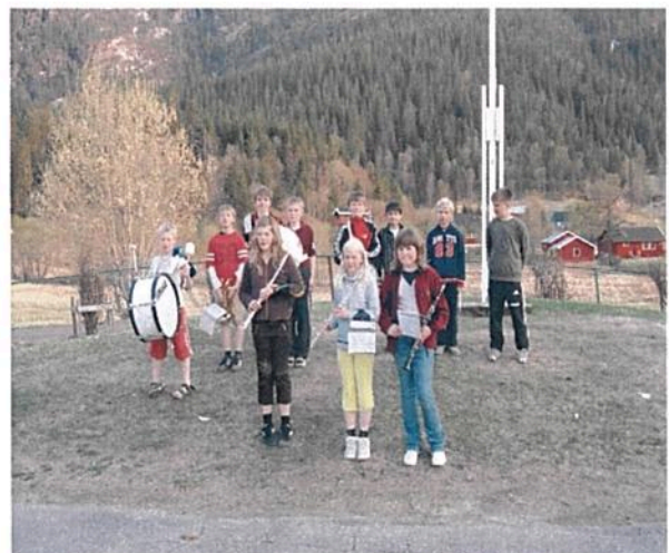
Dalselvkorpsets aspiranter 2006. Interessen blandt de unge er til stede !