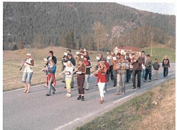
Dalselvkorpset øver foran