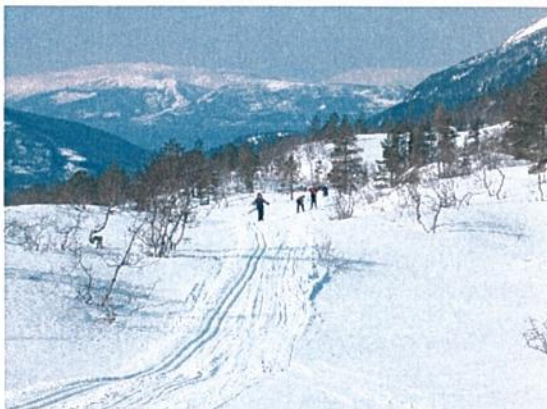
Er det mulig å være sur her ?