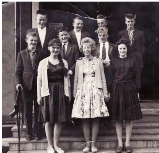
Avgangsklassen Dalsgrenda skole 1962