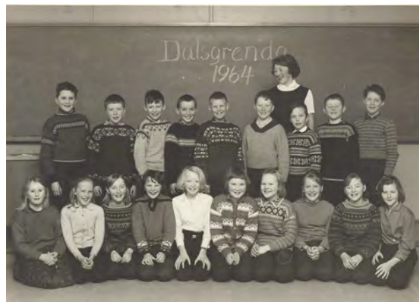
4. klasse Dalsgrenda skole 1964