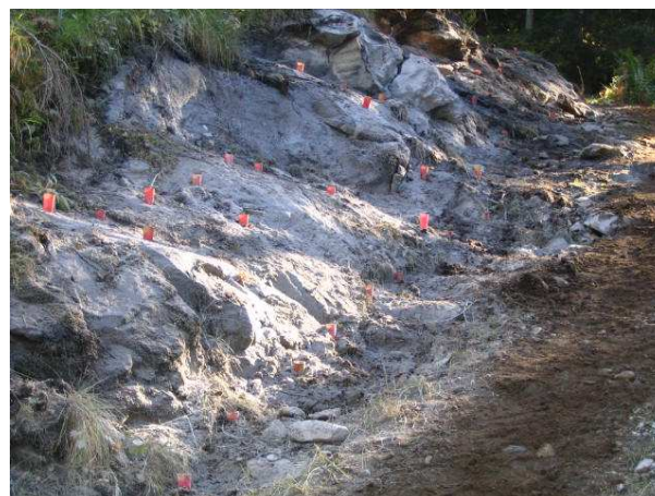
H er det boret og klart for sprenging.

Det er siden forrige avis "opparbeidet vei " fra Hølbekkmoen og ned skaret og de aller ivrigste gravemaskinkjørerere har allerede forsert dette tidligere veiløse området. Det er i samme periode arbeidet en god del på skogsbilveien oppom Brattforsen, og nå er det mulig for både fire og sekshjulinger å møtes uten problemer.