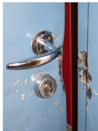
Jerndøra som ble brutt opp. Om de ikke har lyst til å gjøre noe nyttig arbeid så har de iallfall lagt innsats her.

Dette er alvorlig for skolen. Vi var bra rustet på datautstyr men et slikt tap er tungt å ta. Alt for mye av undervisninga og læringa er lagt opp mot bruk av data.