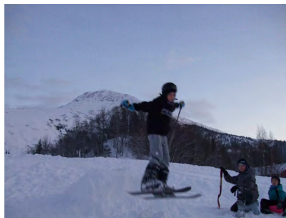
Ute sto blant annet hopp på programmet.