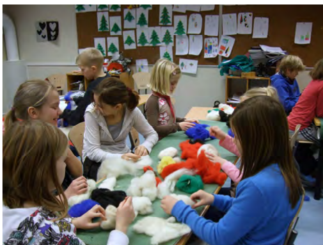
Ungene produserte mye fint på ullgruppa Tekst og foto: Siv Hege Ersdal