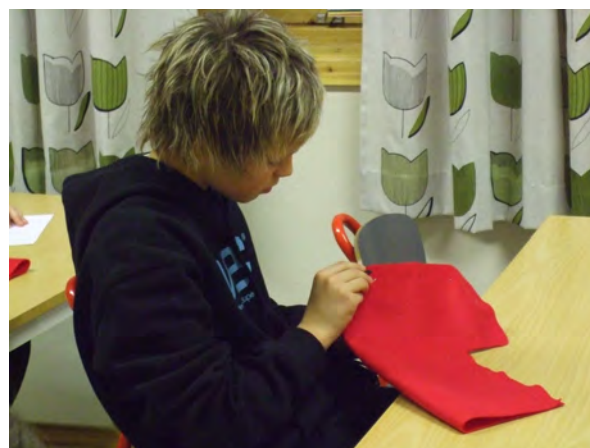
På filtgruppa var det julestrømpe som var temaet

Det å være ute, var i år nytt på programmet og kan vel kalles et utslag av det å være en Terra kommune. Skolen så seg nemlig nesten ikke råd, til å kjøpe inn noe nytt til juleverkstedet. I år ble det stort sett brukt rester fra åra før og i stedet for at elevene fikk gjøre noe nytt inne, ble det noe nytt ute. Tiltaket var for øvrig veldig populært, spesielt blant guttene.