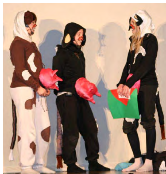
Tekst og fotto: Gunn Berg

Koret, som bestod av de yngste elevene, fortjener også ros. Alle sang av full hals, de sang rent og kom inn akkurat der de skulle, ikke minst takket være en eminent dirigent som hadde full styring!