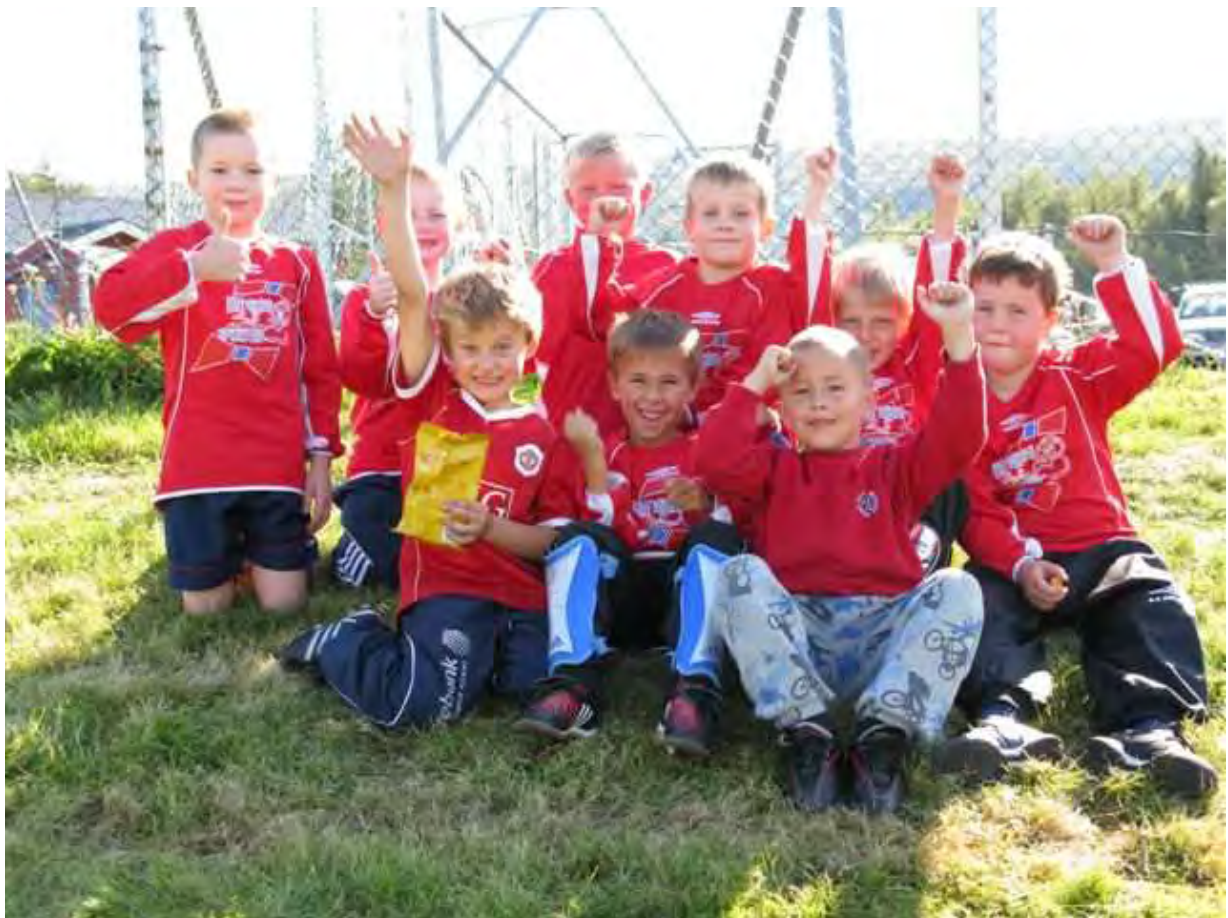
Her bilde av de aller yngste fotball-gutta