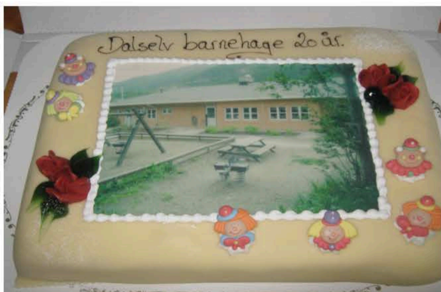
Vi fikk sponset kake fra bakeriet

I april fylte barnehagen 20 år. På grunn av ombygging måtte vi utsette feiringa til i oktober. Det ble en trivelig ettermiddag med fullt hus.