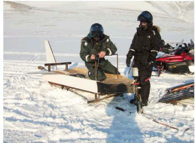
Her er vinneskuta. Den ble døpt Spaceshuttel og hadde påmotert fungerende rakettmotorer

Konkurransen går ut på å ake ned bakken, 600 meter, på kortest mulig tid. Vi stilte med bedriftslaget "Svalsat" og vant med tiden 27 sekunder, hele 4 sekunder foran andreplassen. Det ble en kald seier med hele -23grader den dagen, men fantastisk vær.