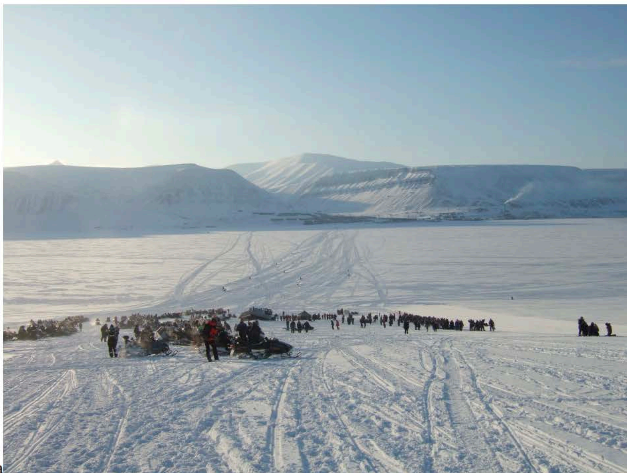
Ta sjansen. Longyearbyen bak i bildet, antallet skutere til stede er rundt 600