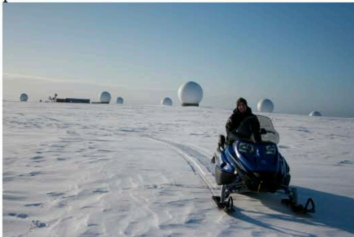
Bildet av arbeidsplassen

Jeg kom til Svalbard den 3 mars 2011, da var det nok så kaldt og forblåst her oppe. Jeg hadde fått jobb i Kongsberg Sattelite Service avdeling Svalbard. Her driver vi verdens største leverandør av tjenester knyttet til kontroll av og datamottak fra jordobservasjons- og miljøsatellitter i polare baner.