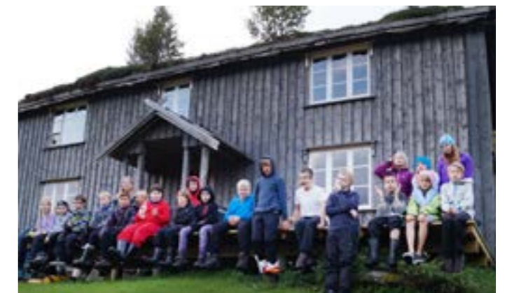
Alle foran Håjen