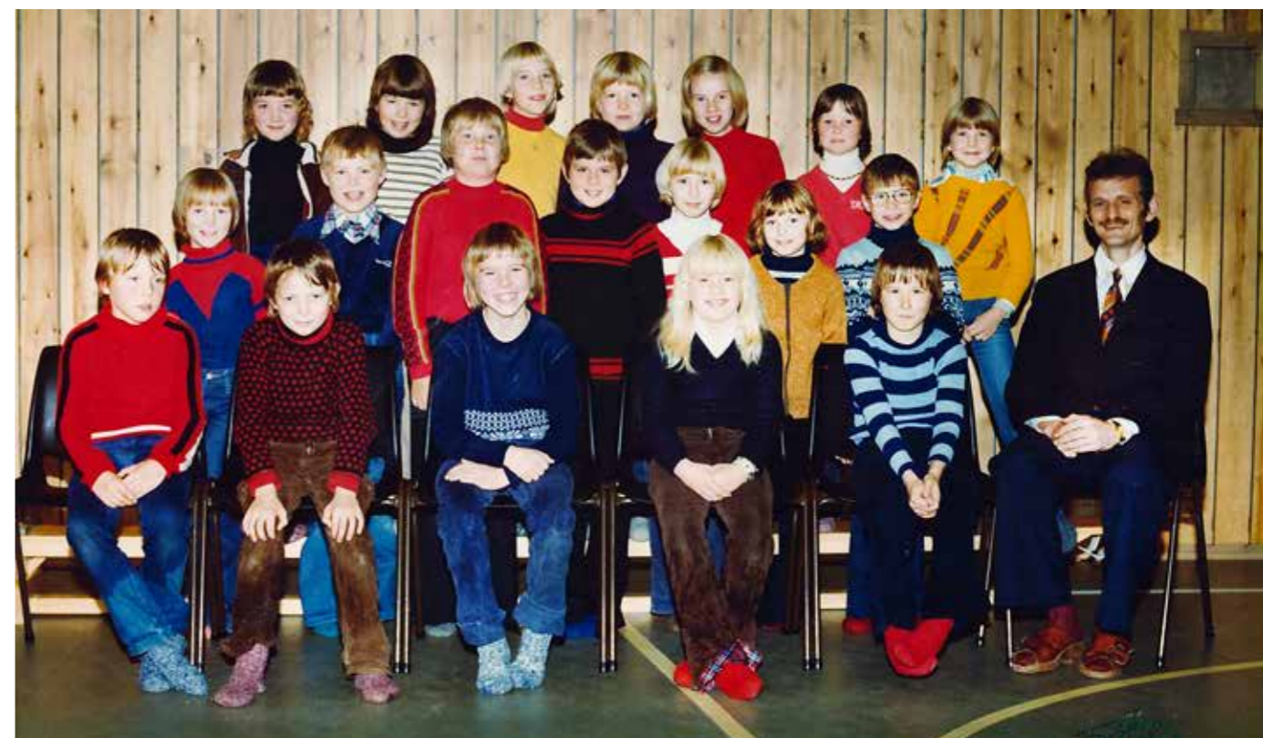
Bildet er av to klassetrinn, 5. og 6. klasse. De 4 første på fremste rekke er 6. klasse og de andre er 5. klasse. Bildet er antagelig tatt 1981, da de fra 6. klasse gikk ut.

Med vennlig hilsen dalsgrendgrisen@gmail.com Ørjan