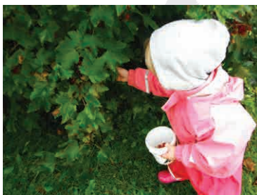
Høsting av rips i Tullas hage.