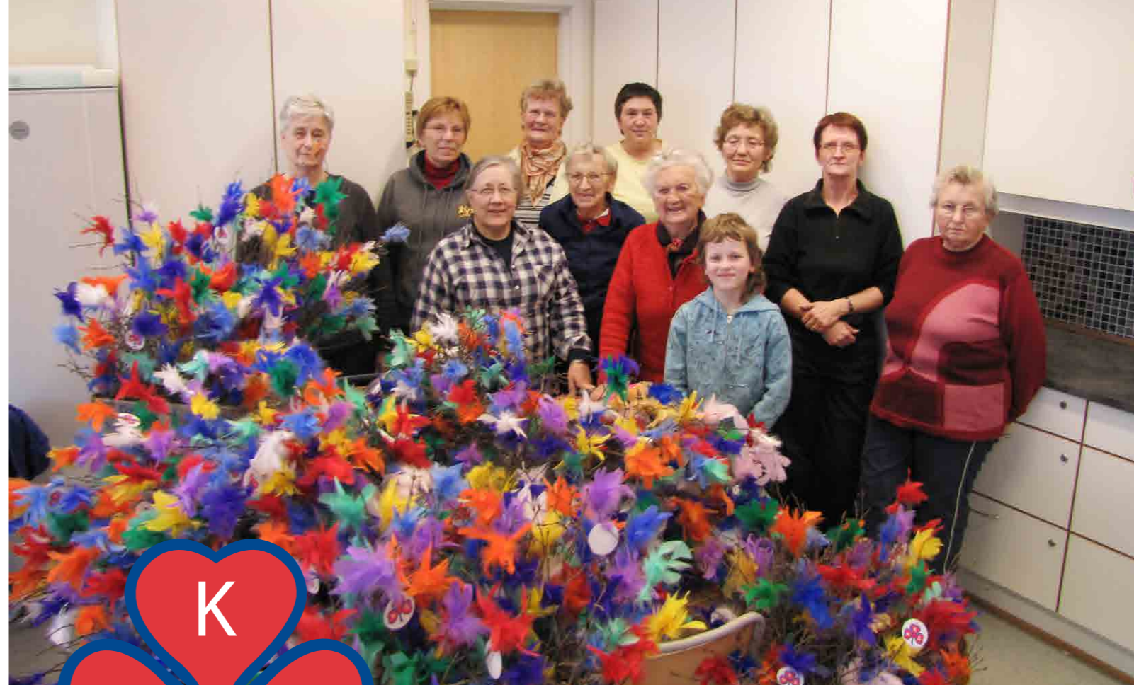
Fra fjærknyttinga til fastelavensrisene i 2010.