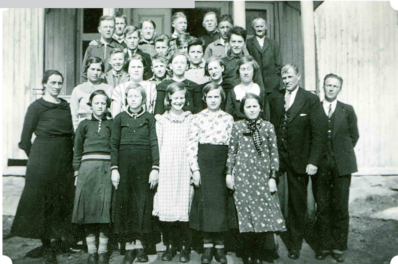
Bilde fra skoletrappa, trolig en gang i perioden 1935-1937