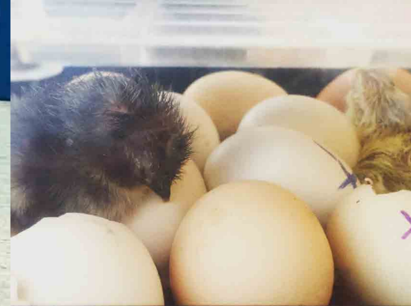
Helt ny i verden, 3 timer gammel.